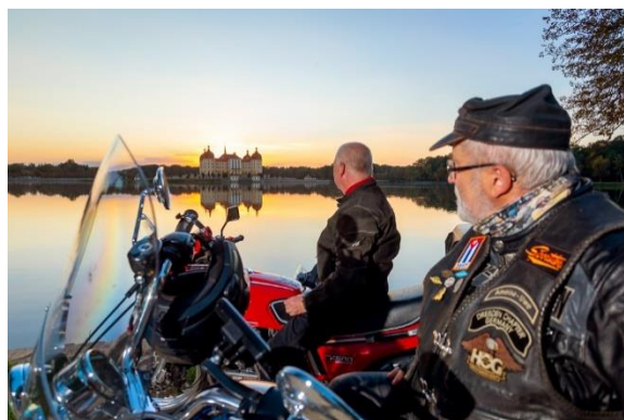
Per Bike zu ländlichen Sehenswürdigkeiten (Schloss Moritzburg)

Bis Ende 2021 haben die LAG Elbe-Elster und Elbe-Röder-Dreieck noch die Werbeagentur für die Marketing-Unterstützung beauftragt, finanziert aus Eigenmitteln der beiden LAG-Trägervereine. So ist für Mai 2021 eine weitere Motorradausfahrt geplant.